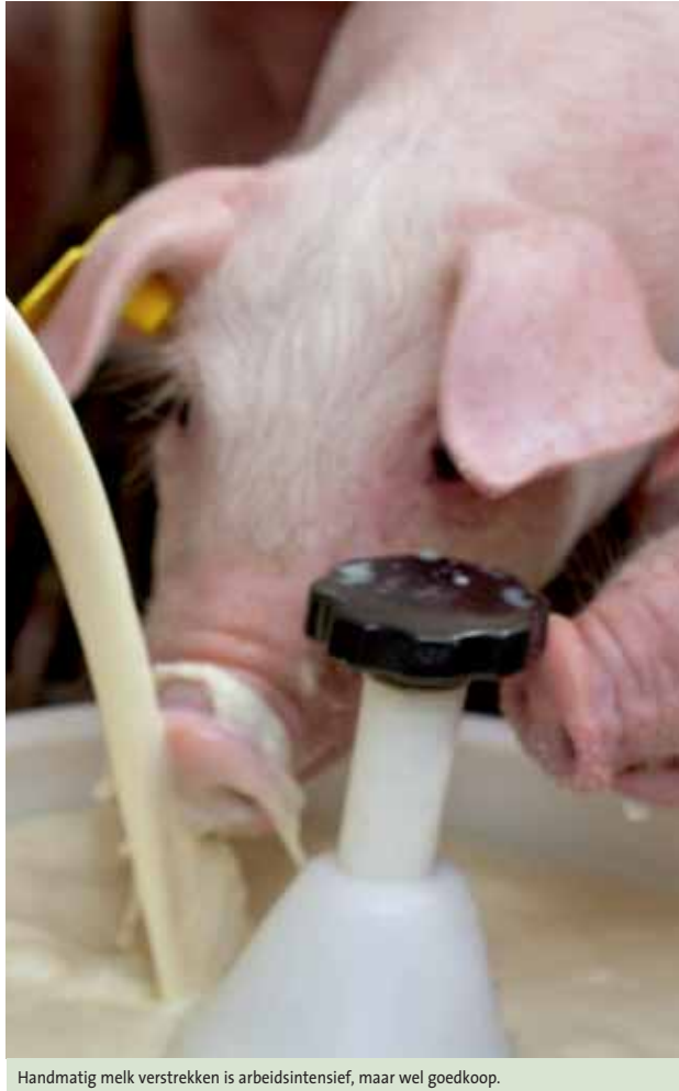
Handmatig melk verstrekken is arbeidsintensief, maar wel goedkoop.

Namens VIC Sterksel is Dirx betrokken geweest bij een verkennende proef, waarbij melkverstrekking aan zuigende biggen werd onderzocht. Als meest opvallende conclusie noemt