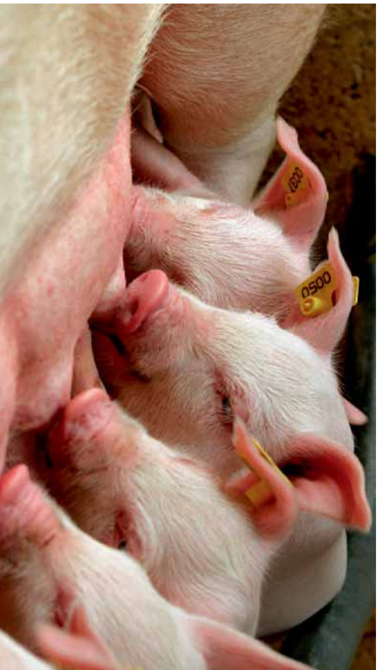
De almaar groter wordende tomen dwingt de varkenshouder tot het zoeken naar oplossingen.